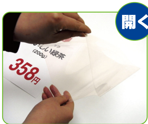
1. チューブケースを開きます。