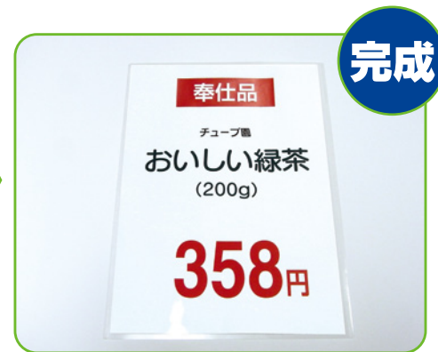
3. 最後にチューブケースの中でPOPを開き、完成です。