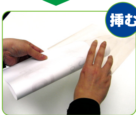
2. 開いた所にPOPを丸めて差込みます。